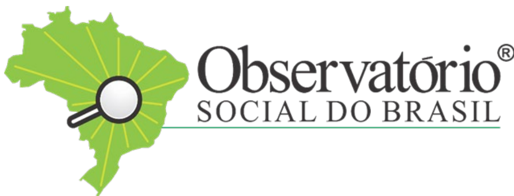
Nova Logomarca do OSB

Buscando o fortalecimento do Sistema OSB e proteção da marca e identidade que vêm ganhando destaque pelas ações de cada unidade que hoje está presente em 16 estados e mais de 150 cidades, o Observatório Social do Brasil atualizou sua marca para o uso de todo o Sistema, agora, cada uma das unidades poderá ser reconhecida através do nome “Observatório Social do Brasil”.