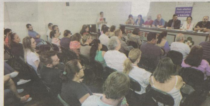
Plenária do Comus aprovou por unanimidade o relatório que pede a suspensão do contrato e o envio do documento para análise do MPF e MP-PR

De acordo com o informe do prefeito, o relatório emitido pela Comissão Especial Ampliada (CEA), encabeçada pelo Comus, será encaminhado à Secretaria Municipal de Saúde para que se manifeste — e, em seguida, caberá à PGM analisar as duas versões sobre o tema para, em seguida, tomar as medidas cabíveis ao processo. O parecer formalizado pela CEA recomenda ao município a imediata suspensão do contrato 031/2017, além da revisão de todos os contratos celebrados neste ano no âmbito da Secretaria Municipal de Saúde e ainda a formação de uma equipe com o objetivo de se apurar a responsabilidade dos