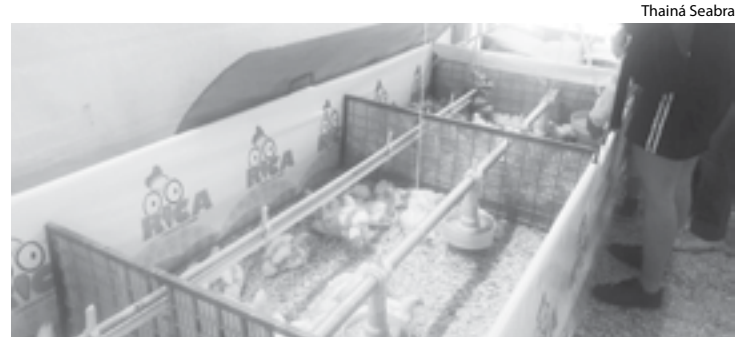
ANIMAIS também chamaram atenção do público