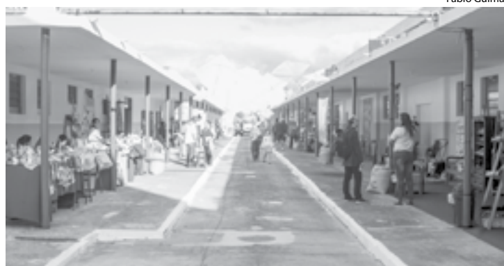
QUEM passou pelo espaço se encantou com a diversidade de produtos

Outra atração da cultura é o estande do Instituto Clécio Penedo, que está fazendo a promoção da 19ª Flumisul. Logo na entrada do evento, o estande mostra uma linha do tempo da vida de Clécio Penedo. Quem passa pelo local pode conferir um histórico de toda trajetória do artista mineiro que residia em Barra Mansa, onde produziu diversas obras de arte – essas, inclusive, compõem acervo de grandes museus e já foram expostas fora do país.