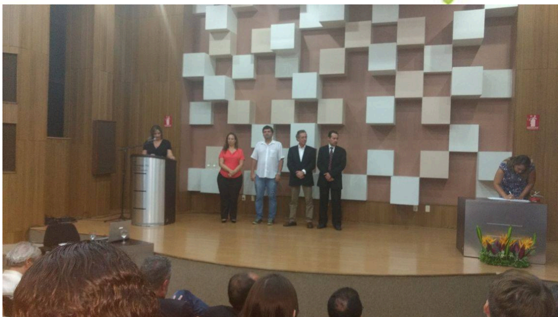
Reunião com Presidente da Câmara Municipal (Ver. Folha) para entrega de Carta de Recomendações com sugestões para a mudança do Regimento Interno do Legislativo.