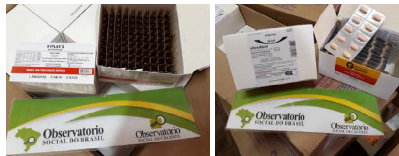
Foto de uma das entregas acompanhadas pelo Observatório Social

Nós do Observatório Social de Cáceres realizamos a conferência de 100% (cem por cento) de todas as entregas. Como em todas as organizações erros e inconformidades podem acontecer, mas os que foram detectados por nossos observadores foram prontamente resolvidos pela equipe do almoxarifado da saúde, não necessitando de intervenção deste Observatório. A eficiência na entrega de medicamentos junto a Secretaria Municipal de Saúde é fruto de constantes conferências por parte dessa Entidade, e também o compromisso e seriedade dos servidores envolvidos diretamente com essa atividade. Dentre os pontos sempre analisados na hora da entrega dos medicamentos estão: Conferência qualitativa (que se refere à qualidade entregue): • Integridade das embalagens; • Condições em que foram transportados; • Conferência quantitativa dos medicamentos (quantidade); • Atendimento às especificações do edital; • Verificação da inscrição "Venda Proibida ao Comércio"; • Verificação do prazo de validade e • Se a marca e embalagem atende ao que foi ofertado pela empresa na proposta; • Atestar o recebimento na DANFE, com o carimbo do observatório e assinar.