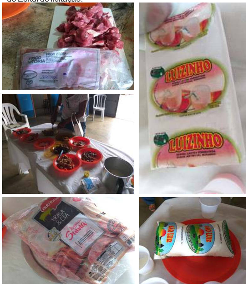
Fotos dos produtos avaliados pelo Observatório Social e demais Entidades interessadas.

Observem caros leitores, pelas informações acima, que após várias vezes os produtos sendo reprovados, os fornecedores da Prefeitura resolveram se adequar as especificações do Edital de licitação.