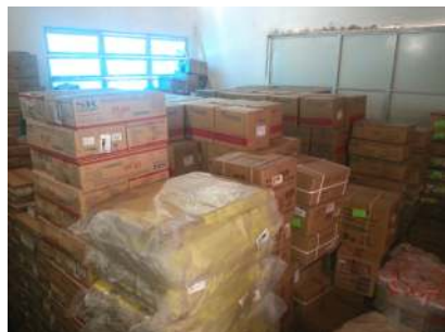
Detalhes da antiga instalação ao lado da Secretaria Municipal de Saúde.

Ainda há muito que melhorar, pois os materiais ficam acondicionados em caixas de papelão sobre paletes. O ideal seria distribuí-los em prateleiras e separa-los pelas características do material, alguns critérios de separação são: fragilidade, volume, peso, forma entre outros. Assim tornaria o trabalho menos oneroso e facilitaria a gestão e controle desses medicamentos.