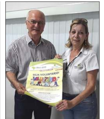
Francisco de Assis – Parque dos Ipês