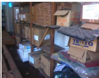
Detalhes da nova instalação