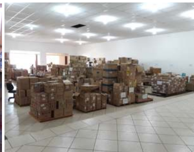
Detalhes da nova instalação