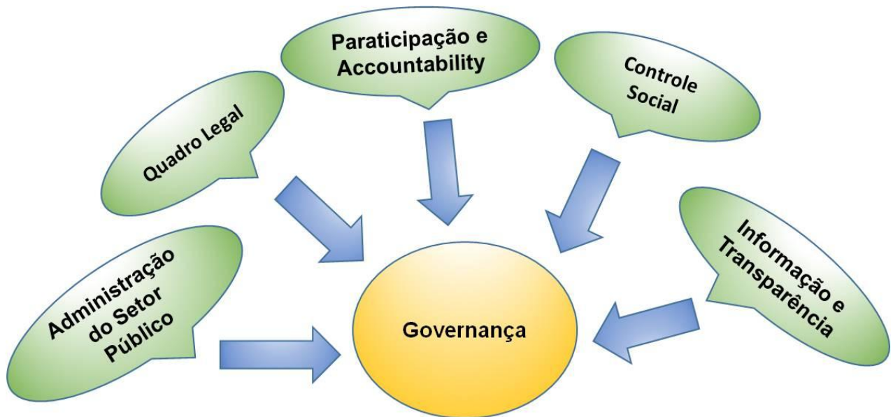
Figura 1 – Desempenho

Para Matias-Pereira (2010), administração do setor público zela pela melhoria do gerenciamento econômico e prestação de serviços sociais e a questão burocrática; no quadro legal, infere-se que o princípio da legalidade em que os atos do agente público sejam em virtude de lei; considera que a participação e a transparência são fundamentais para aumentar a eficiência econômica, envolve-se a disponibilidade de informações sobre as políticas governamentais. A transparência dos processos de formulação de política e alguma oportunidade para que os cidadãos possam influenciar a tomada de decisão sobre as políticas públicas.